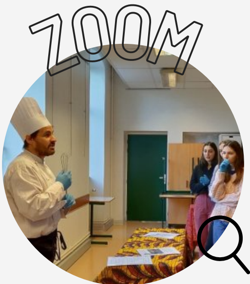
Le banquet truculent !